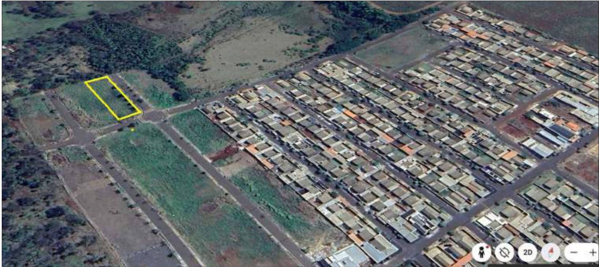
Local da obra SEM ESCALA